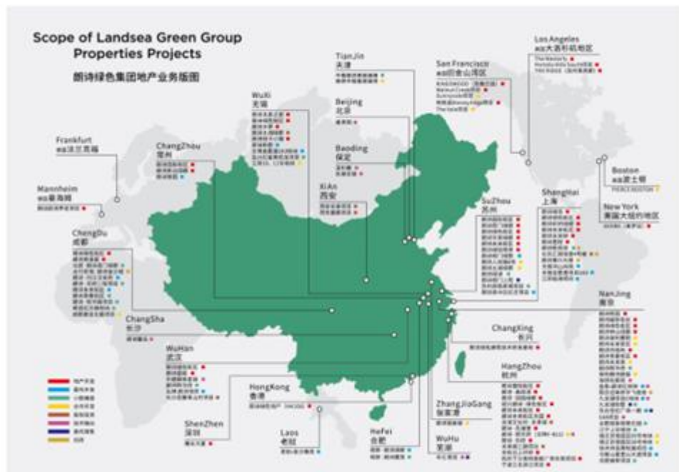
(朗诗绿色集团业务版图)

公司现有员工 3000 余人，其中具有中高级职称人员超过 150 人，服务项目覆盖长三角及长江中上游，先后进入南京、常州、无锡、苏州、杭州、上海、成都、武汉、绍兴、张家港等 19 个城市，截止 2018 年，朗诗物业管理面积达 1500 余万平方米，业主数量达 35 余万。